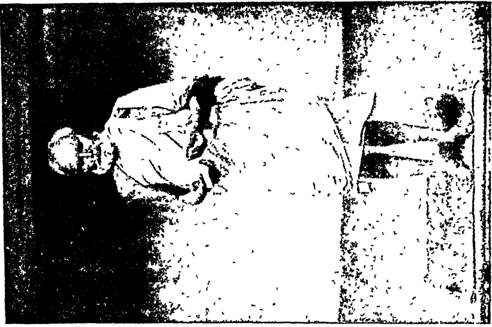
सद्गुणानुरागी मुनिवर्भ श्रीमान कंपुपिसवनी महाराज